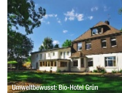
Umweltbewusst: Bio-Hotel Grün