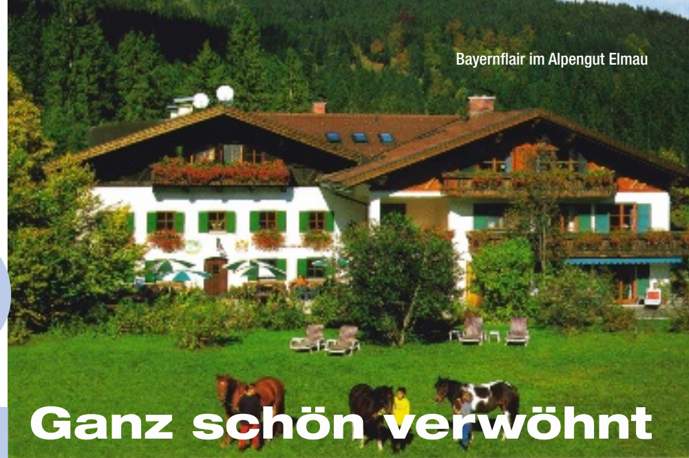
Bayernflair im Alpengut Elmau