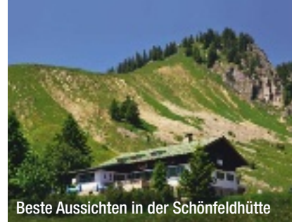
Beste Aussichten in der Schönfeldhütte