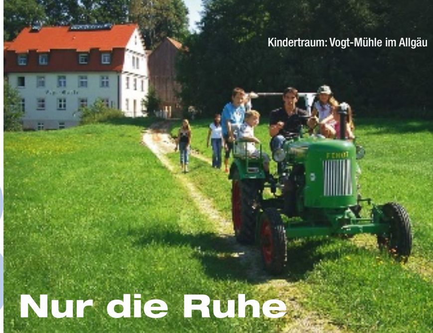
Kindertraum: Vogt-Mühle im Allgäu