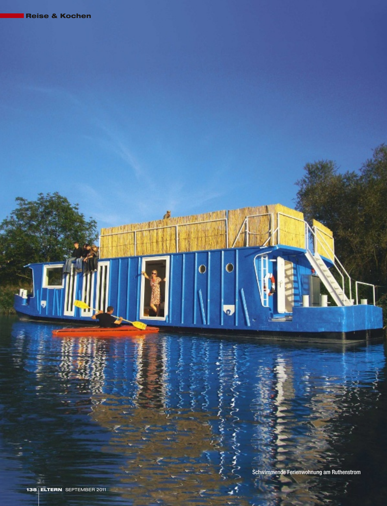
Schwimmende Ferienwohnung am Ruthenstrom