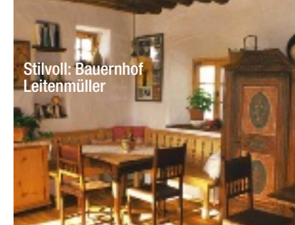
Stilvoll: Bauernhof Leitenmüller